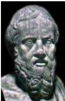
Fig 4: Herodoto (484 AC – 426 AC) es considerado "el padre de la Historia". Su afán por conocer tierras y gentes le llevó a viajar por numerosos países: Egipto, Persia, Libia, la Magna Grecia, la Hélade ... Durante dos años vivió en Atenas invitado por Pericles, estableciendo amistad con Sófocles.

Salvo Esparta, Grecia evoluciona en el siglo siguiente hacia estructuras sociales menos aristocráticas y más participativas. En el ámbito deportivo, se sigue buscando, desinteresadamente, el honor y el triunfo en todos los ámbitos, pero el atletismo y la gimnasia, antes aristocráticos, pasan a ser centrales en la formación militar y en la educación básica general. Al acceder mucha más gente a las bondades de la práctica deportiva, se extiende por todo el mundo griego el afán por competir o presenciar las competiciones.