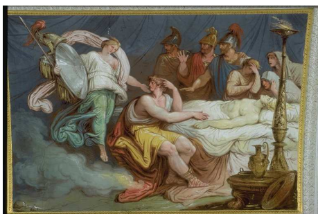
Aquiles velando el cadáver de su amigo, escudero y primo Patroclo. Tetis intenta darle consuelo.